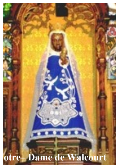
Notre-Dame de Walcourt

Les uniformes les plus hétéroclites, les armements les plus bizarres, une animation pas toujours très di-gne, prêtent en somme, un caractère plutôt païen ou carnavalesque à chacune de ces « marches » de l'Entre-Sambre-et-Meuse. Il y en a à Walcourt, à Jumet-Heigne. La « marche » en question sort le dimanche le plus rapproché du 22 juillet, fête de sainte Marie-Madeleine. A Florennes, à Thy-le-Château, à Morialmé, à Biesmerée, à Villers-Deux-Eglises, à Gourdinne, à Silenrieux, à Acoz... Toutes sont annuelles, sauf celle de Fosses Marbaix, Lobbes, Aiseau, Berzée ont des compagnies de « marcheurs » prêtant leur concours à des processions organisées ailleurs. A Chatelet, il y en a également, car, dans cette localité, autrefois, il y avait la « marche de Saint-Eloy », aujourd'hui tombée en désuétude; mais, dans la région, on est « marcheur » de père en fils, comme, à Binche, on est Gille par hérédité ou tradition de famille; alors, on reste fidèle à la coutume. Les « marches militaires » rappellent les anciennes insécurités des routes et, si l'on vérifie les origines, par exemple, de la « procession militarisée » de Lembeek-les-Hal, on constate qu'elle est née du fait de la fameuse petite « Guerre de Lembeek »: celle-ci opposait Gossuin d'Enghien au comte de Hainaut, le premier ayant reçu la seigneurie, en prêt, de Wauthier de Lens, le second l'ayant obtenue en engagèrent (1182-1210).