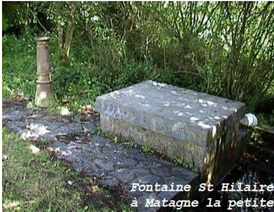
Fontaine St Hilaire à Matagne la petite

Que de pèlerinages célèbres continuent à être assidûment suivis, dans l'Entre-Sambre-et-Meuse ! Des légendes de guérisons miraculeuses s'attachant à Notre-Dame de l'Arbrisseau, à salle-lez-Chimay, tous les sept ans, un pieux cortège de fidèles s'y rend. Dans les cas désespérés de maladies, on emploie, à Thorimont, la « triple eau bénite » de Pâque, de la Pentecôte et de la Trinité. Sainte Aragononne ou Radegonde, à Villers-Poteries, dans une veille chapelle sis face à l'église, est invoquée pour les maladies de la peau.